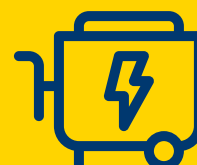
El, Opvarmning, Ventilation og Affugtning