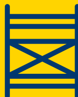
Stillads og overdækning