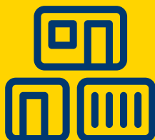
Moduler, Pavilloner og Containere